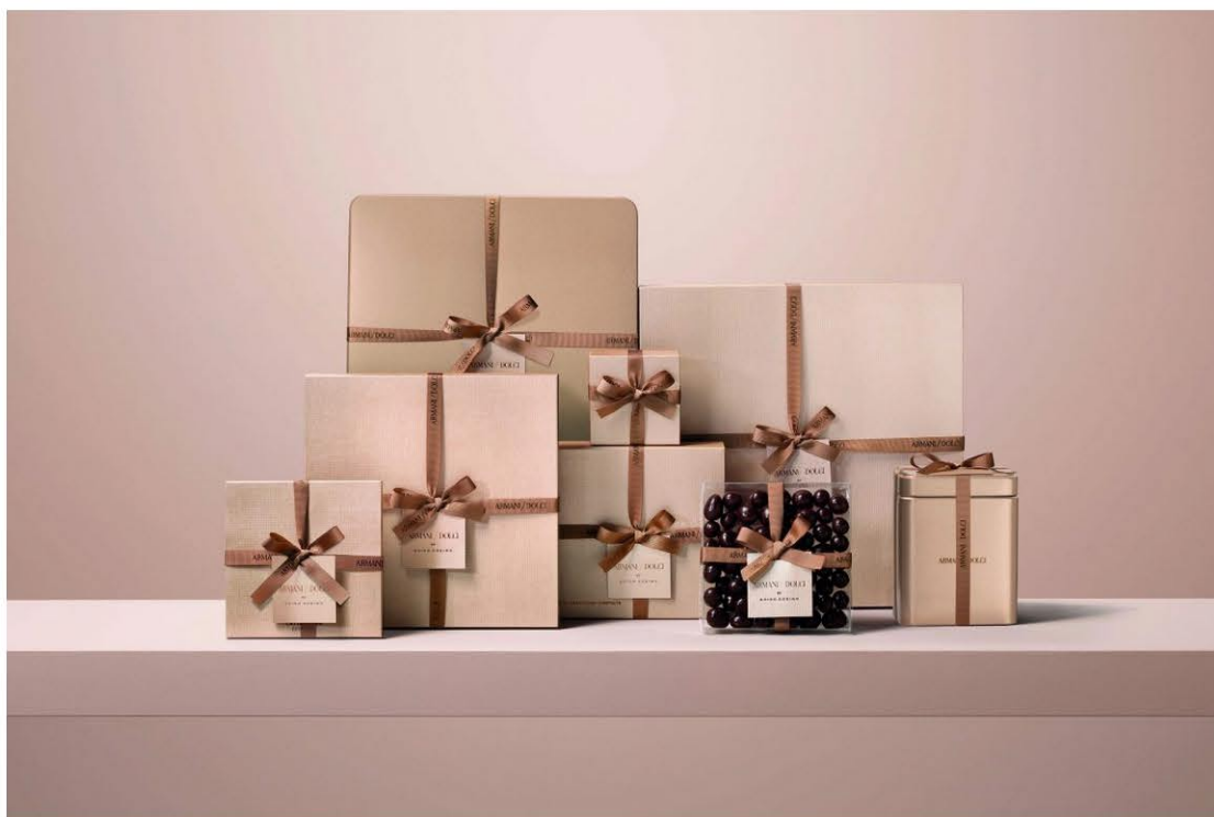
Armani Dolci by Guido Gobino

Scrivo di moda e tutto ciò che le gravita attorno.