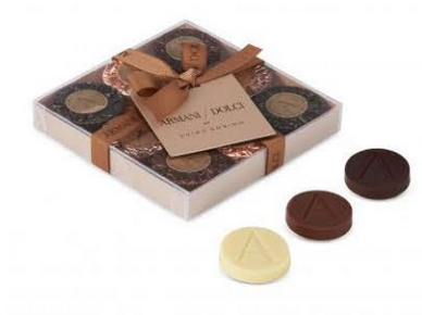
Armani Dolci by Guido Gobino

La sua avventura inizia nel 1964 quando Giuseppe Gobino, padre di Guido, grazie all'esperienza acquisita fin dal 1950 nella raffinazione del cacao, fa il suo ingresso come responsabile di produzione in quella che al tempo era solo una piccola fabbrica di caramelle. Qualche anno dopo, ha inizio un processo di ricerca nel settore del cioccolato, che privilegiava i prodotti tipici torinesi quali il gianduiotto, la crema di cioccolato gianduia e il cioccolato con nocciola. Nel corso dei Giochi Olimpici Invernali del 2006, inoltre, Gobino ottiene la qualifica di "Ambasciatore di Torino", insieme ad altri 80 rappresentanti del mondo dell'impresa e della cultura piemontese.